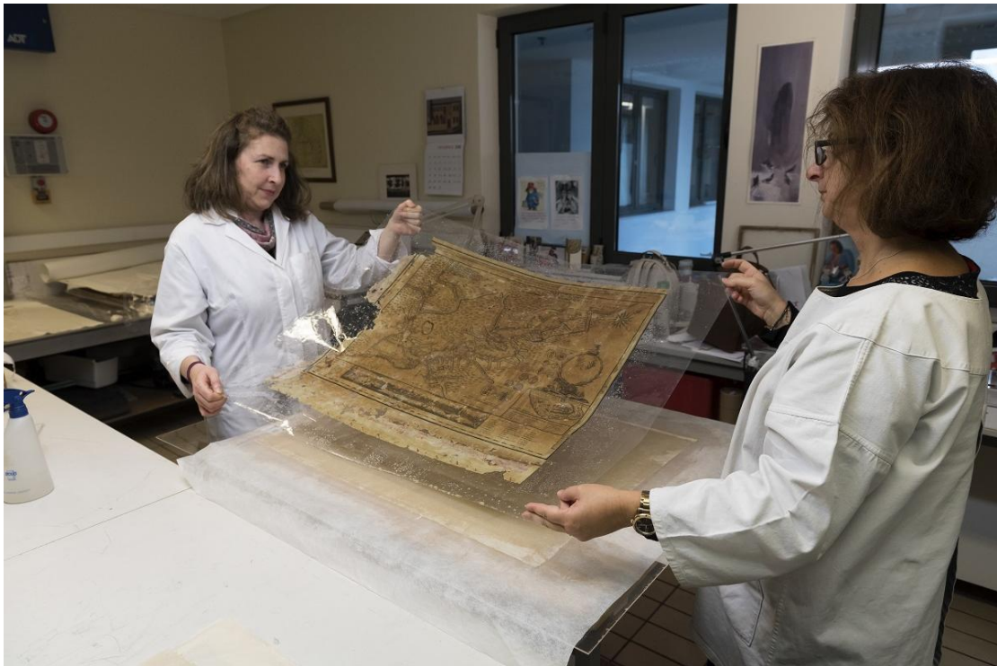
Εικ.5-9 : Εργασίες συντήρησης της Χάρτας στο Βυζαντινό και Χριστιανικό Μουσείο.