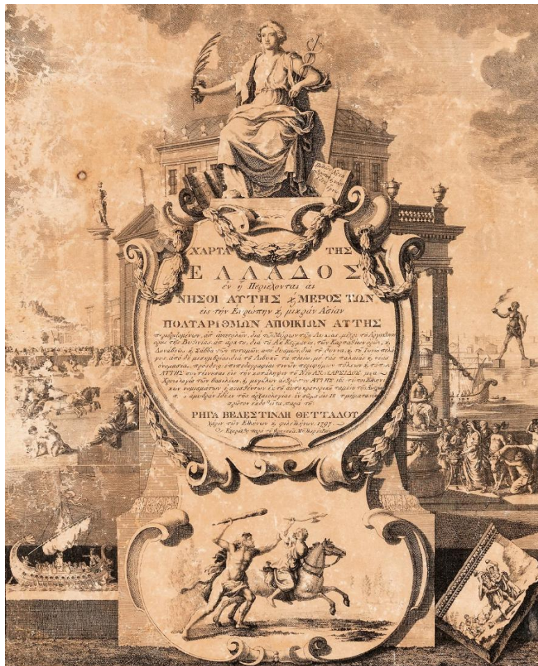
Εικ2. : Η Δέλτος της Χάρτας