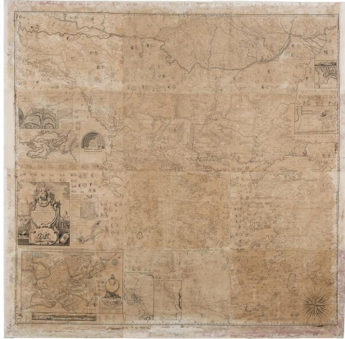
Εικ1. : Αποψη της Χάρτας του Ρήγα